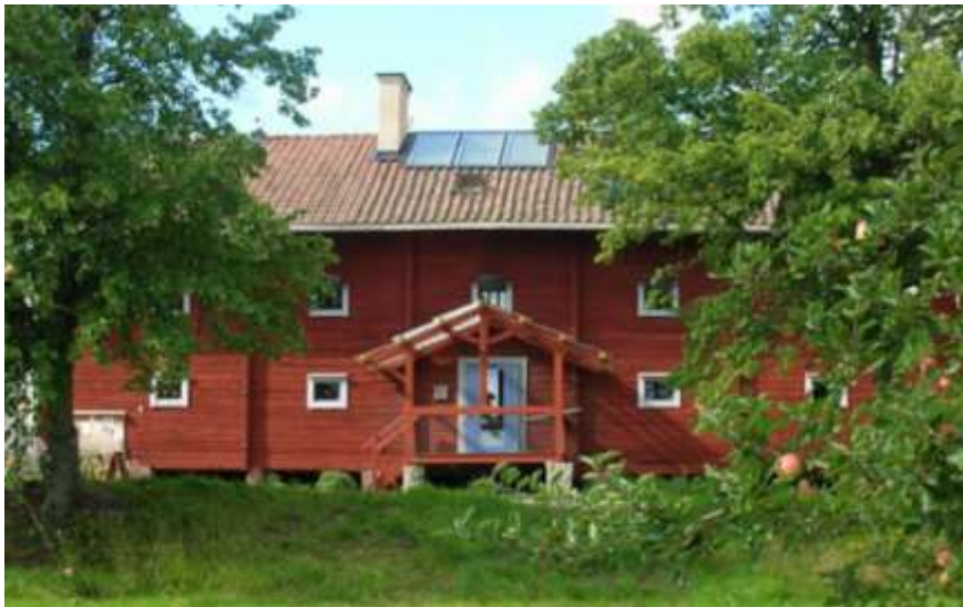
Ekobankens kontor i Järna, söder om Södertälje.

Föreningsstyrningsrapporten motsvarar Bolagsstyrningsrapport för aktiebolag och har som syfte att skapa goda förutsättningar för utövandet av en aktiv och ansvarstagande ägarroll samt att skapa största möjliga transparens gentemot bankens ägare, övriga kunder och samhället i övrigt. Här behandlas hur Ekobanken tillämpar Svensk kod för Bolagsstyrning. Reglerna i denna kod är inte tvingande, utan principen är att företaget ska följa koden eller förklara avvikelserna från den. I slutet av rapporten kommenteras de fall där Ekobankens praxis är annorlunda eller lagstiftningen är annorlunda för medlemsbanker än för bolag. Dessutom innehåller rapporten en beskrivning av hur Ekobanken tillämpar Finansinspektionens allmänna råd om styrning och kontroll av finansiella företag