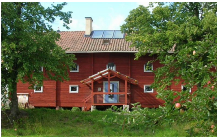
Ekobankens kontor i Järna, söder om Södertälje.

Föreningsstyrningsrapporten motsvarar Bolagsstyrningsrapport för aktiebolag. Den återfinns på bankens hemsida och syftar bland annat till en utvidgad transparens för företag med spritt ägande.