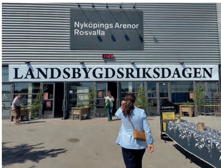
På väg till Landsbygdsriksdagen i Nyköping.

Det ställdes många bra frågor, hölls intressanta diskussioner och det var ett mycket roligt och inspirerande besök.