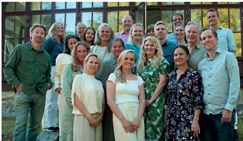
En del av Ekobankens medarbetare.

EKOBANKEN ÄR EN TRANSPARENT OCH HÅLLBAR BANK - HOS OSS VET DU VAD DINA PENGAR GÖR NÄR DE ÄR PÅ BANKEN.