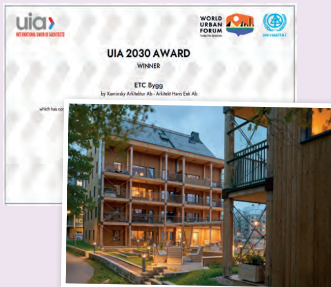
ETC bygg fick tillsammans med Kaminsky Arkitektur det prestigefyllda UIA 2030 Award priset.

Det gläder oss på Ekobanken att våra kunder får så fina priser och uppmärksammas för den skillnad och det arbete de gör.