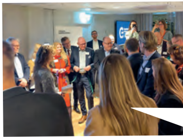
Ekobankens vd var på plats på invigningen av Kooperationens år.