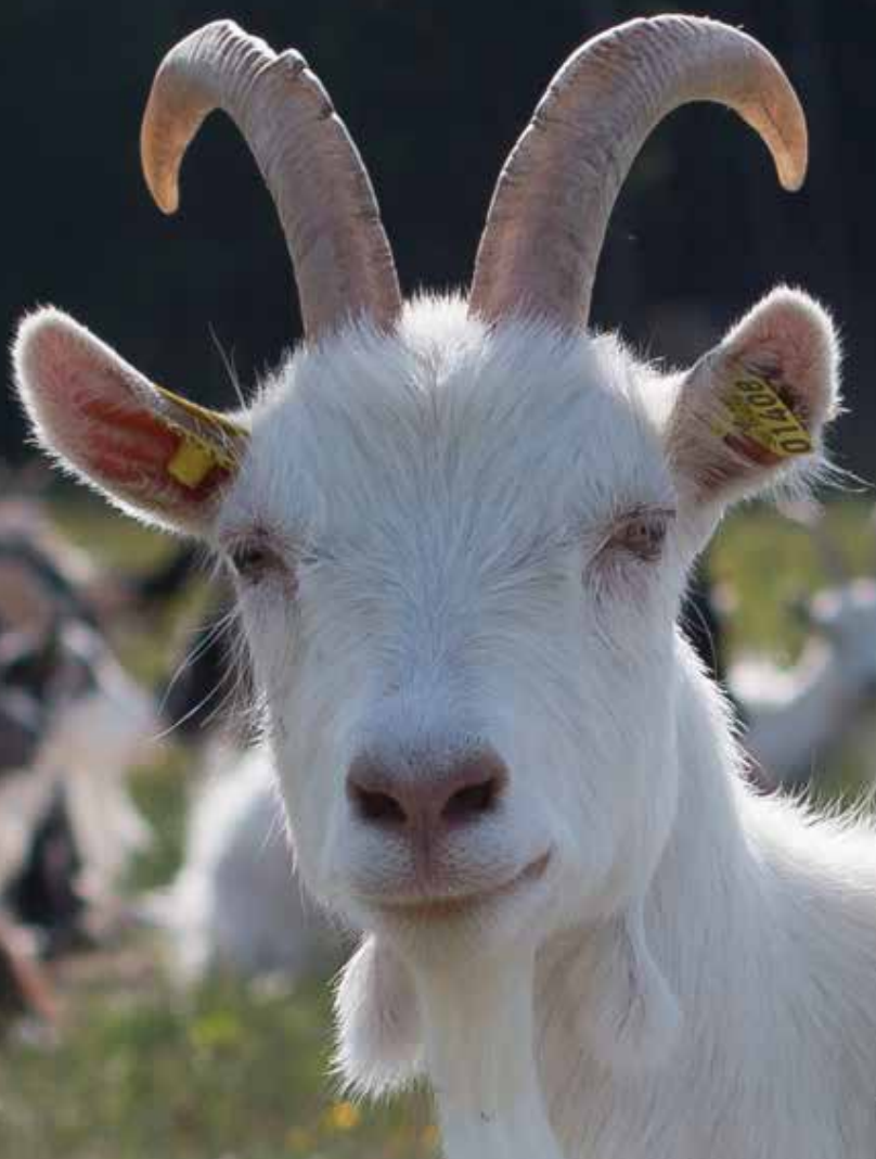
Sörbro Gård - getter som skapar liv på landsbygden.