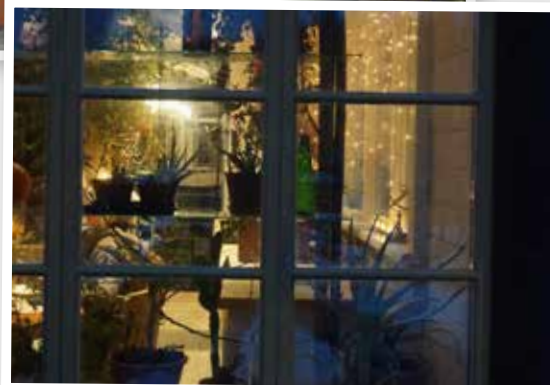
Bilder från Ekoby Växthuset.