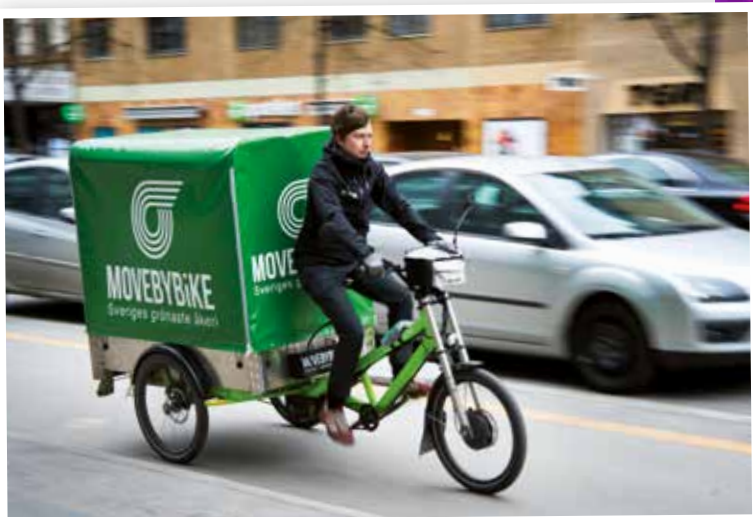
Stockholms Cykelåkeri MOVEBYBIKE kan ta laster upp till 400 kg.